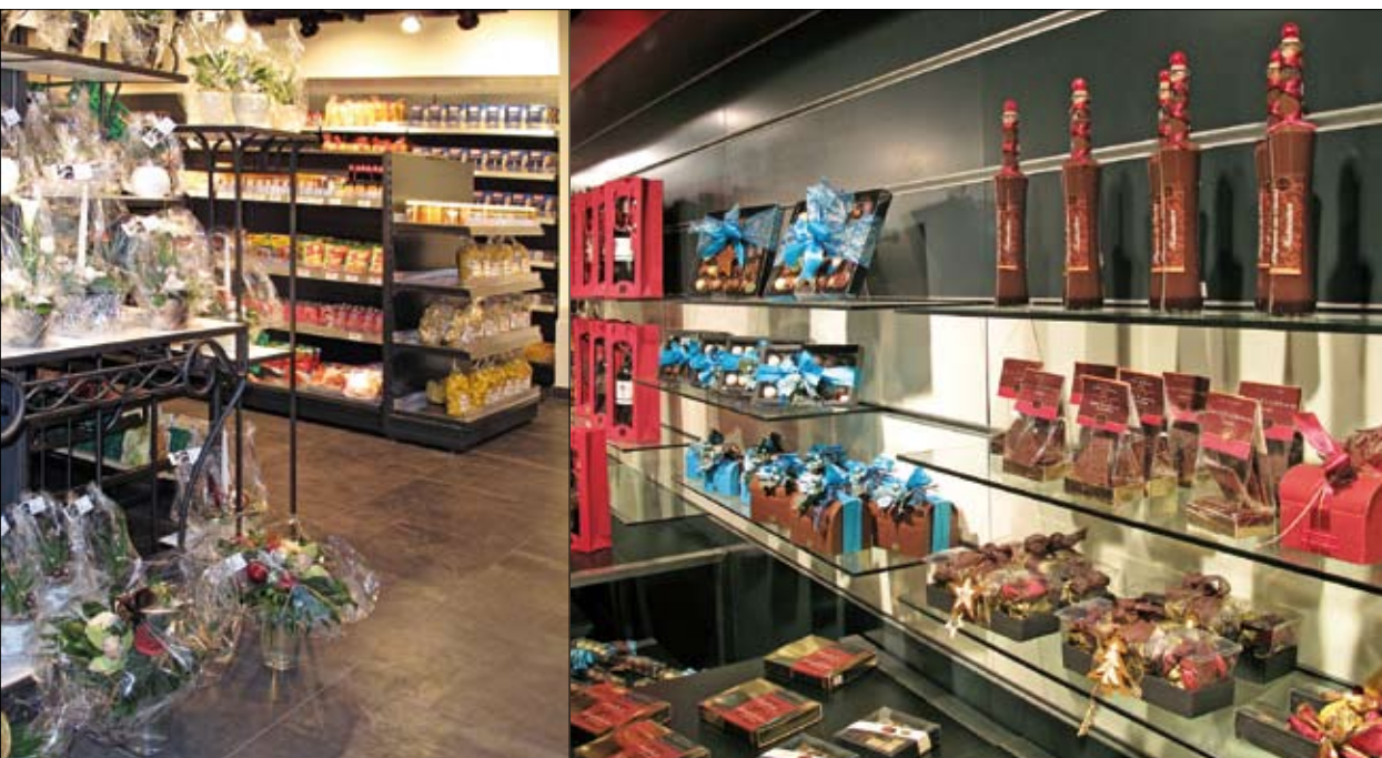
Der Umbau ist gelungen, das Angebot im Shop ist gross. Links: Neben Lebensmittelprodukten werden Gestecke aus dem Blumengeschäft Fiorella angeboten. Rechts: Feines aus der eigenen Confiserie, schön verpackt, lässt das Schenken zu einer Freude werden.

Der Laden und das Tea-Room im Bahnhof Visp sind zu einem beliebten Treffpunkt geworden, dem ebenfalls ein neues Outfit verpasst wurde. In seinem neuen Kleid wirkt er noch ansprechender auf seine Kunden, und auch hier wird grosser Wert auf freundliche und effiziente Bedienung gelegt.