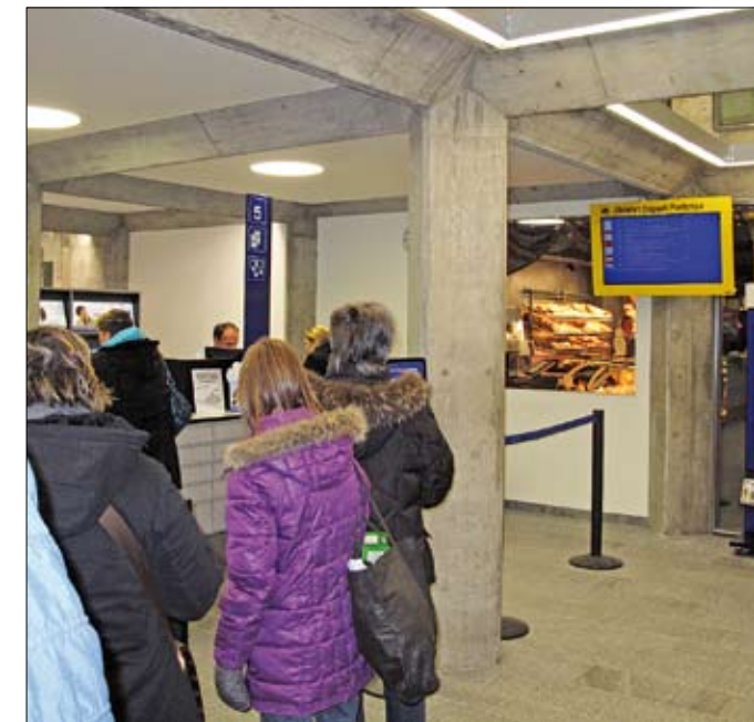
Von der Schalterhalle aus kann der Kunde einen Blick in den Shop der Bäckerei Volken werfen.